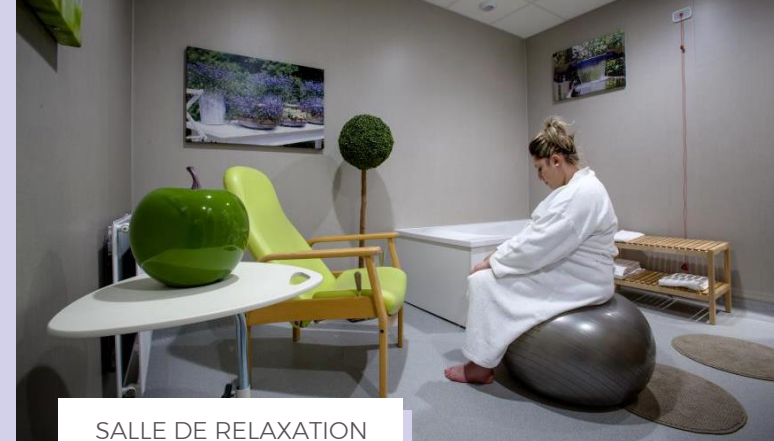
SALLE DE RELAXATION AVEC BAIGNOIRE

L'allaitement maternel au fil des mois : revenez avec bébé quelques semaines après l'accouchement pour partager un moment d'échange convivial avec d'autres mamans qui allaitent.